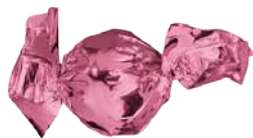
Chocolate de Leite com Recheio de Creme de Avelãs e Cereais