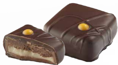
Chocolate Preto com Recheio de Fondant de Laranja e Creme de Avelãs e Chocolate Preto