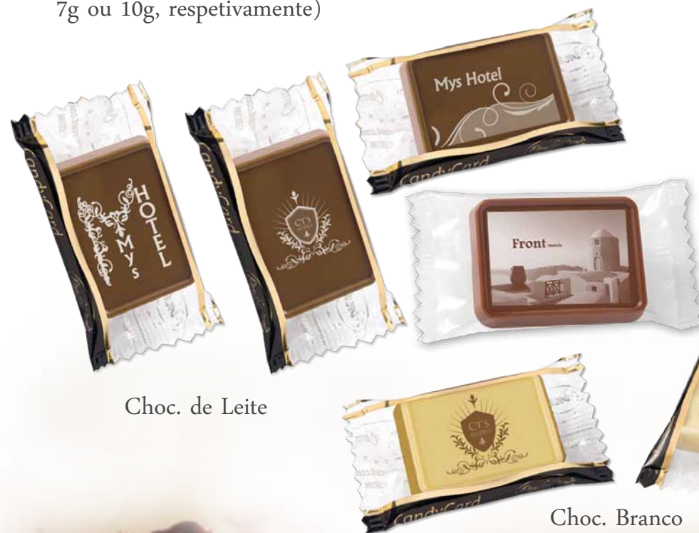
Choc. de Leite

Mini-Tablete personalizável a partir de 1500 un. ou 1600 (5g e 7g ou 10g, respetivamente)