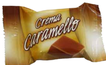
Chocolate de Leite com Recheio de Creme de Sabor a Caramelo