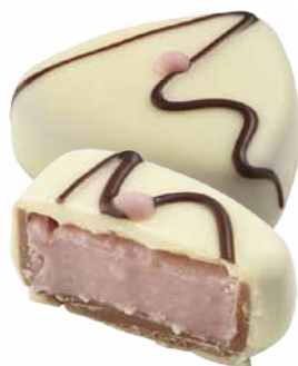
Chocolate Branco com Recheio de Creme de Morango