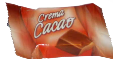
Chocolate Preto com Recheio de Creme de Cacao