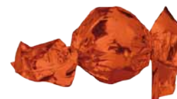
Chocolate de Leite com Recheio de Creme de Laranja