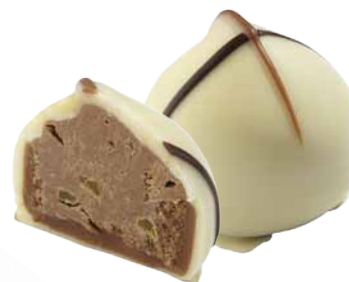
Chocolate Branco com Recheio de Praliné de Amêndoa e Pedacinhos de Laranja