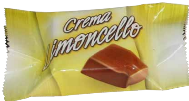
Chocolate de Leite com Recheio de Creme de Sabor a Limoncello