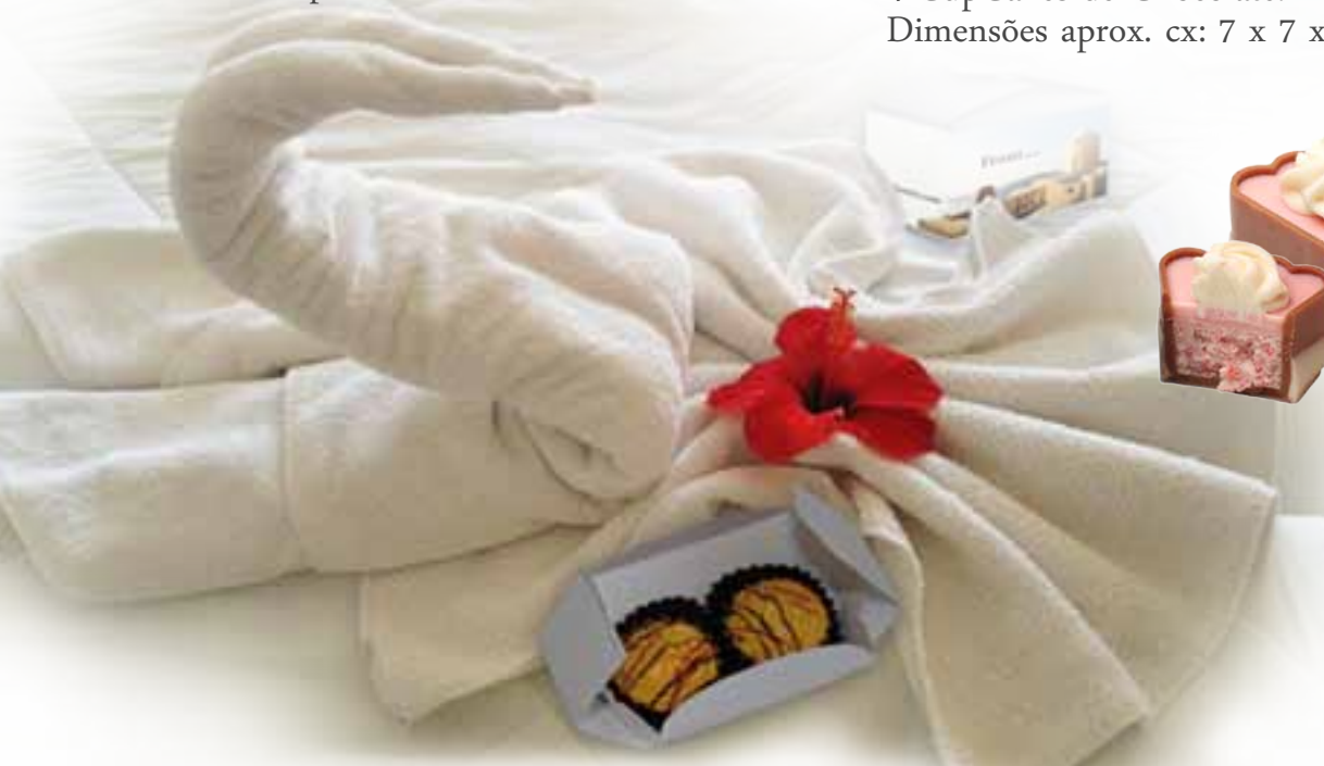
Caixa Sweet - S4

2 CupCakes de Chocolate. Dimensões aprox. cx: 7 x 3,5 x 3,5 cm