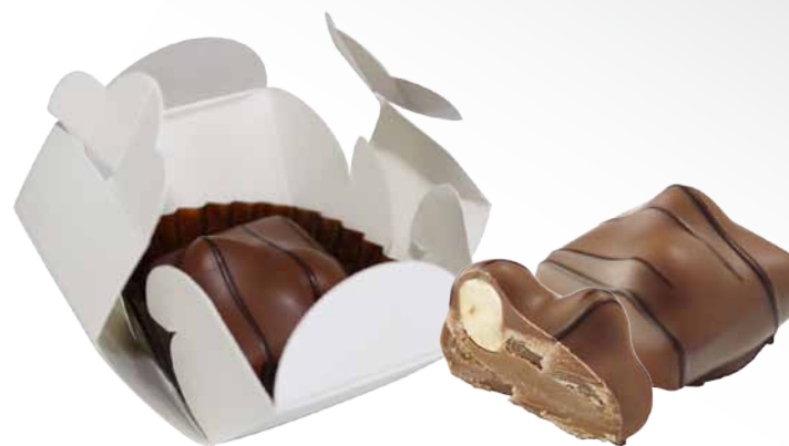
Chocolate de Leite com Recheio de Praliné de Avelãs e 2 Avelãs inteiras