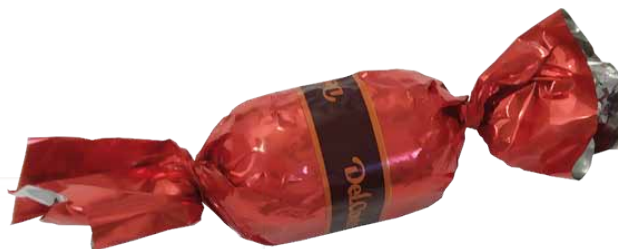
Chocolate de Leite com Recheio de Creme de Avelãs e Avelãs inteiras