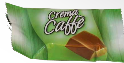
Chocolate Preto com Recheio de Creme de Sabor a Café