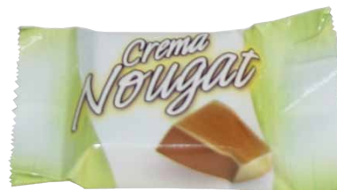
Chocolate de Leite com Recheio de Creme de Sabor a Nougat