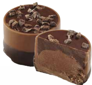
Chocolate de Leite com Recheio de Creme de Mousse de Chocolate Preto e Pedacinhos de Cacau

Avulso [H01] ou em diferentes formatos de caixa [H02].