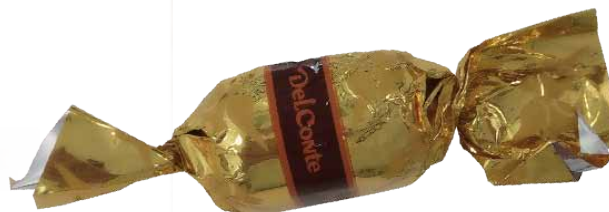
Chocolate de Leite com Recheio de Creme de Avelãs e Amêndoas e Pedacos de Torrao