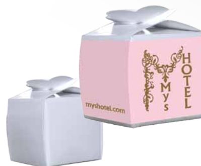
Caixa Sweet - S1