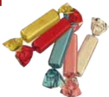
Chocolate de Leite com Recheio de Creme de Avelãs