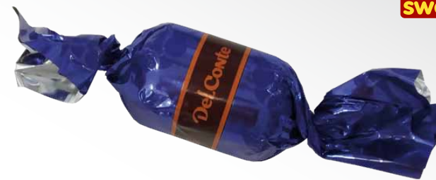
Chocolate Preto com Recheio de Creme Branco e Pedacos de Bolacha de Chocolate