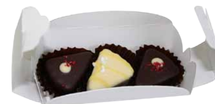
Caixa Sweet - S3