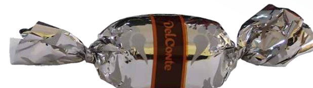
Chocolate de Leite com Recheio de Creme de Avelãs, Amêndoas e Cereais