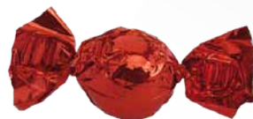
Chocolate de Leite com Recheio de Creme de Nozes de Macadâmia