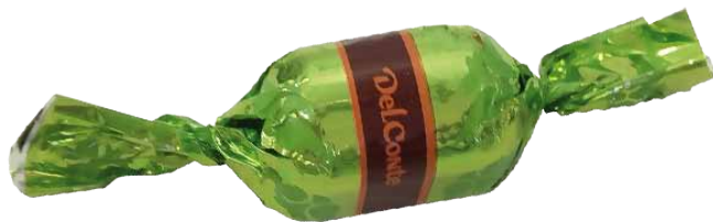
Chocolate de Leite com Recheio de Creme de Leite e Cereais