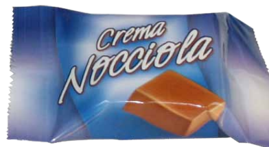
Chocolate de Leite com Recheio de Creme de Sabor a Avelã