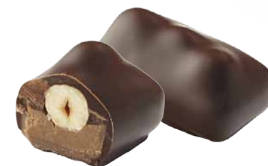
Chocolate Preto com Recheio de Praliné de Avelãs e 3 Avelãs inteiras