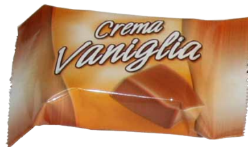
Chocolate de Leite com Recheio de Creme de Sabor a Baunilha