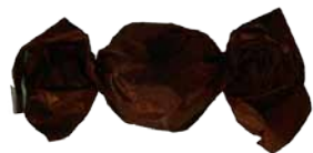
Chocolate de Leite com Recheio de Creme de Menta