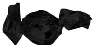
Chocolate de Leite com Recheio de Creme de Café