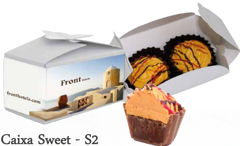
Caixa Sweet - S2

Bombons, Triângulos e CupCakes de Chocolate de leite, preto ou branco decorado e com diversos recheios. Avulso [I01] ou em diferentes formatos de caixa.