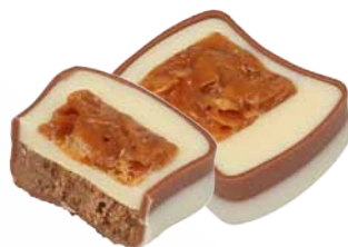
Chocolate de Leite com Recheio de Praliné de Amêndoa e Biscoito Crocante